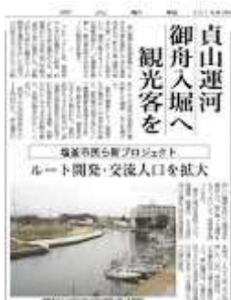
河北新報 記事 2016-04-09.JPG 283K