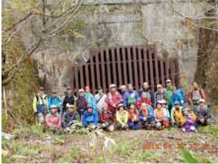
20160429関山隧道記念撮影.JPG 1765K