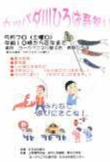
20160507かっぱだ川まつり.jpg 334K