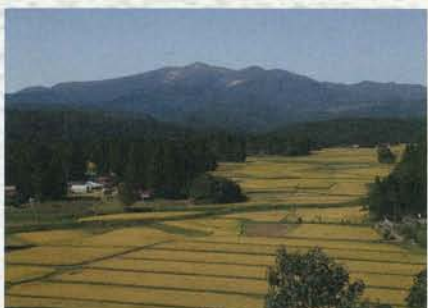
慈恵塚から栗駒山を望む