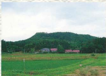
伝ミタケ堂跡(史跡)