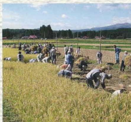
骨寺村荘園稲刈り体験交流会