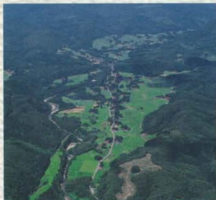
本寺地区を上空から望む