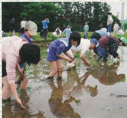
お田植え体験交流会