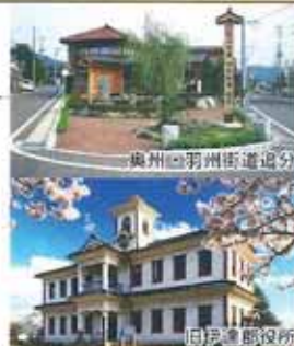
奥州・羽州街道追分