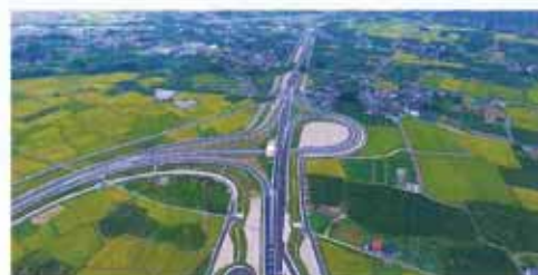
東北中央自動車道 大笹生 IC