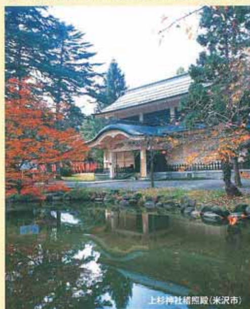
上杉神社徳照殿(米沢市)

◆ご宿泊に関するご案内、ご相談は、(一社)福島市観光コンベンション協会まで。TEL 024-531-6432