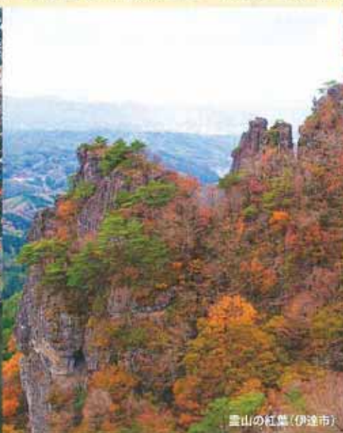
雲山の紅葉(伊達市)