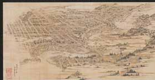
仙台市指定文化財 文久二年仙台北下絵図 文久2年