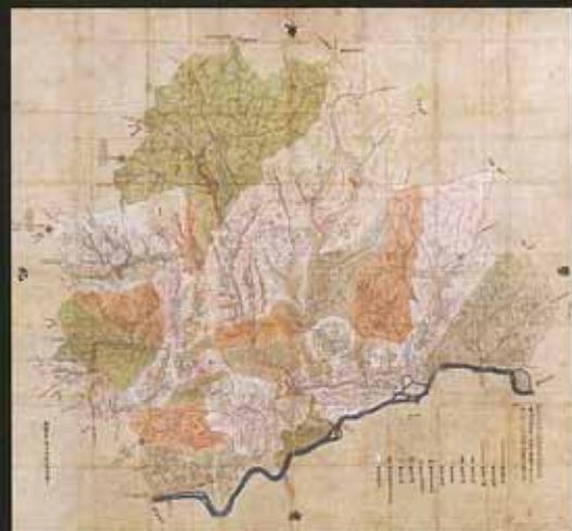
江刺郡分間絵図 元禄10年