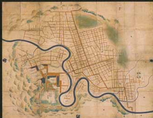
仙台市指定文化財 奥州仙台城下絵図 正保2年