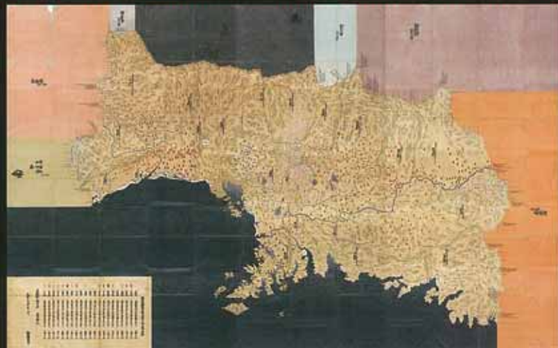
奥州仙台鎮国絵図 元禄14年 車パネル展示