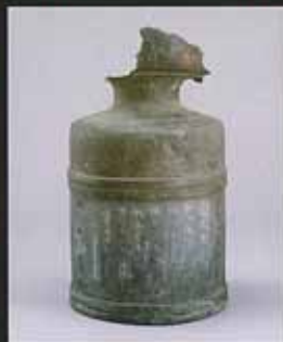
仙台市指定文化財 仙台橋(大橋)の擬宝珠 慶長6年