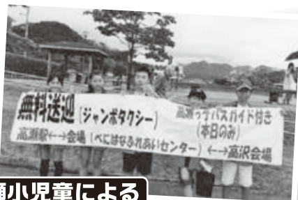
高瀬小児童によるバスガイド

8・9日の2日間は、高瀬駅、山形市十日町「紅の蔵」から本会場・高沢会場まで無料シャトルバスを運行します。