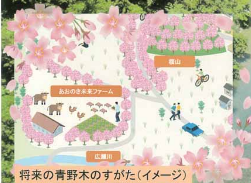
将来の青野木のすがた(イメージ)

仙台市街地から車で30分 広瀬川や田園風景など 自然豊かな環境に加え、 桜の名所とする事で気軽に 楽しめるレジャースポットを 目指しています。